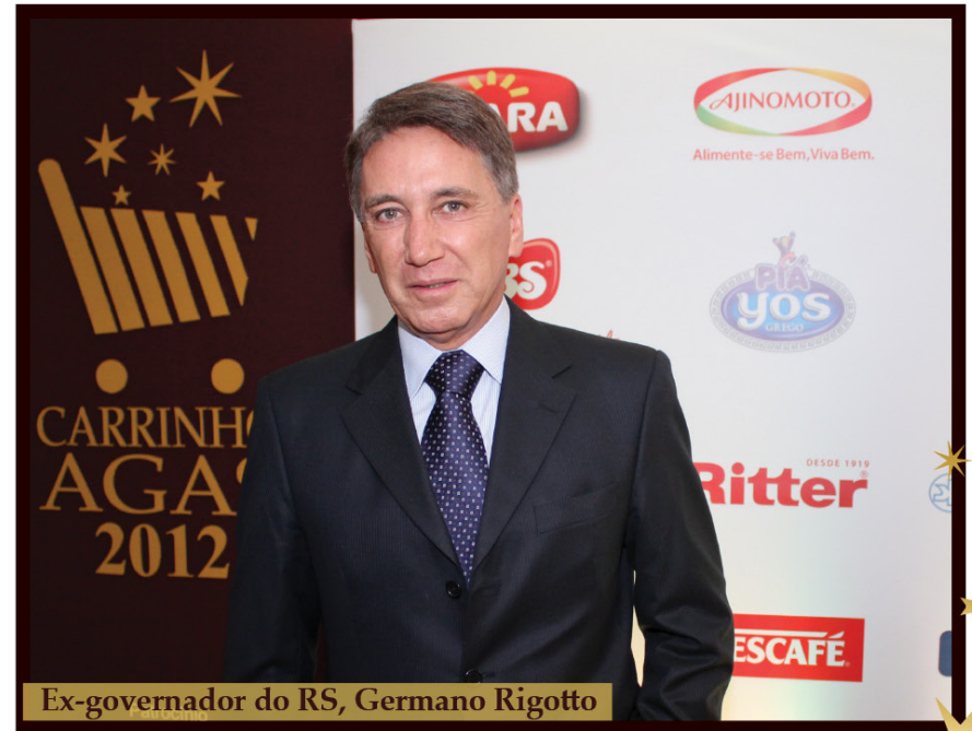
Ex-governador do RS, Germano Rigotto