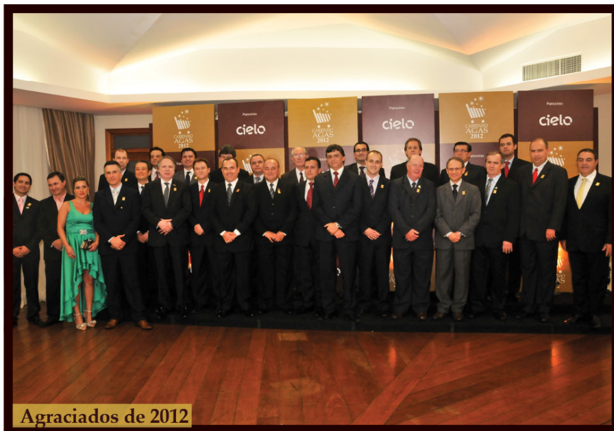
Agraciados de 2012