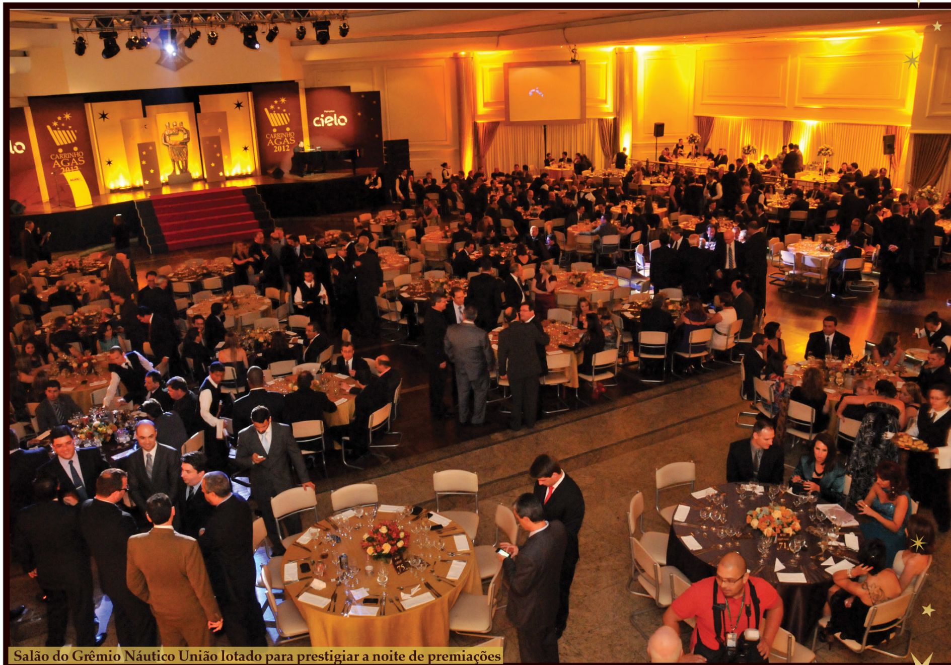
Salão do Grêmio Náutico União lotado para prestigiar a noite de premiações