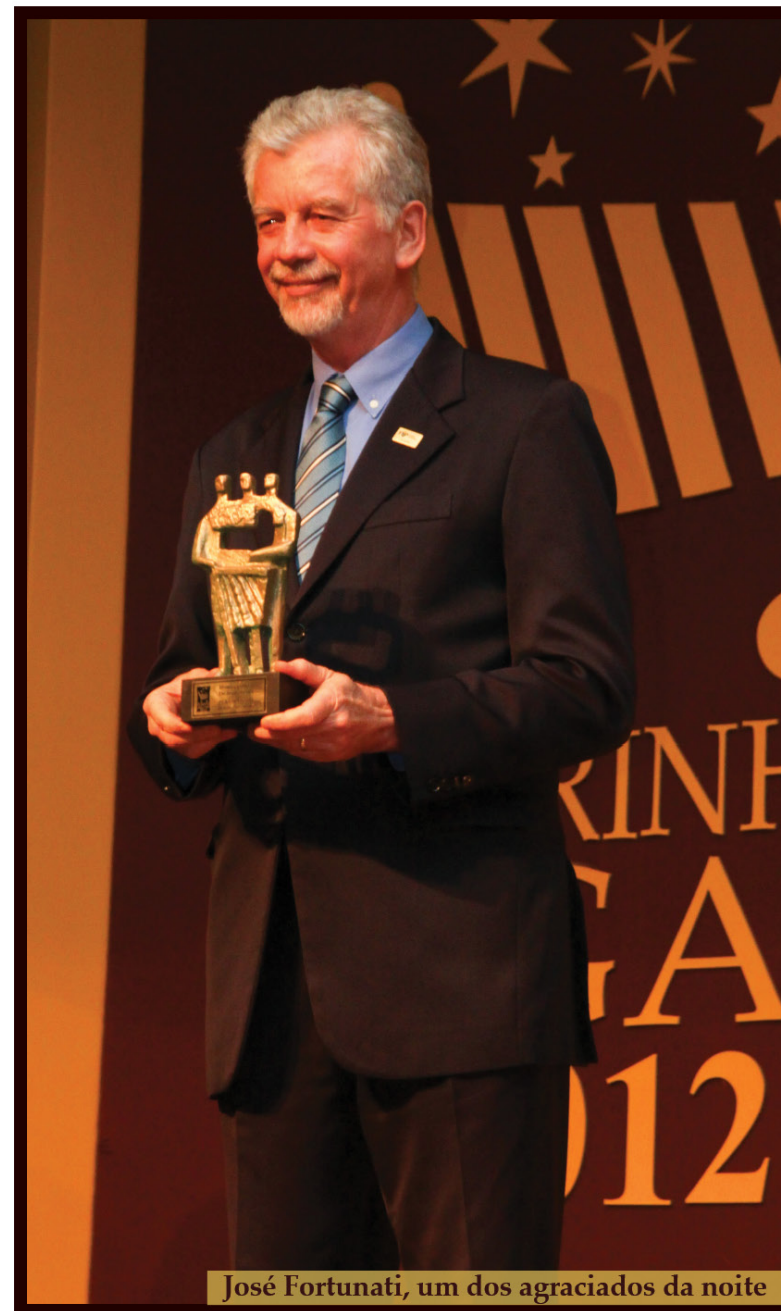
José Fortunati, um dos agraciados da noite

Em 2010 assumiu como prefeito municipal de porto alegre e em 2012 foi reeleito prefeito, em primeiro turno, com 65,22% dos votos válidos.