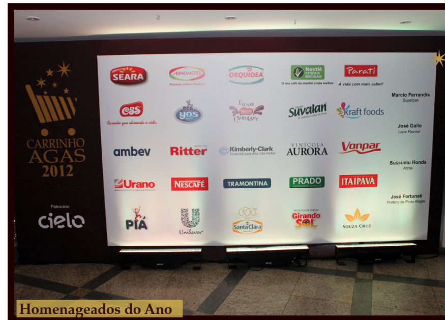
Homenageados do Ano