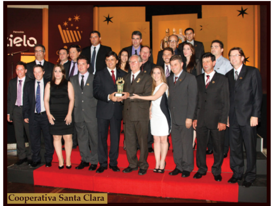
Cooperativa Santa Clara