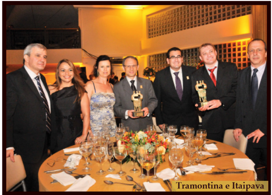
Tramontina e Itaipava