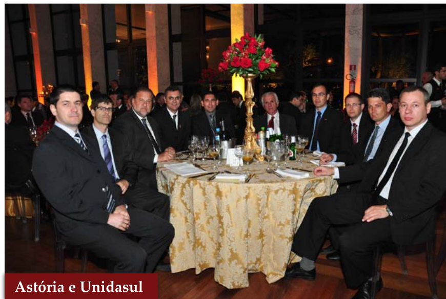
Astória e Unidasul