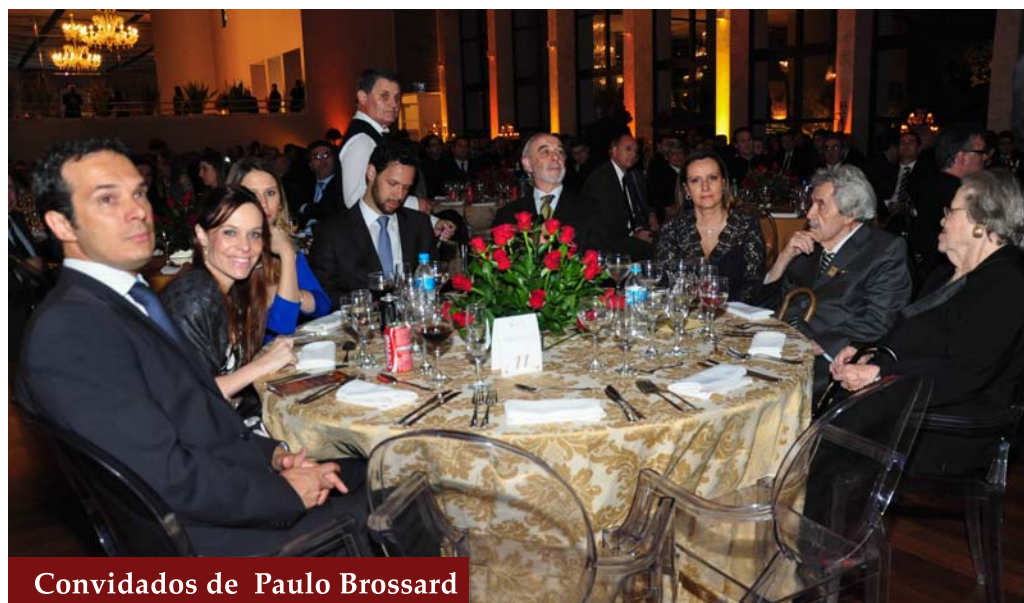
Convidados de Paulo Brossard

Foi nomeado Ministro do Supremo Tribunal Federal pelo presidente José Sarney, em 1989. No mesmo ano, foi eleito juiz substituto do Tribunal Superior Eleitoral, órgão que presidiu a partir de 1992.