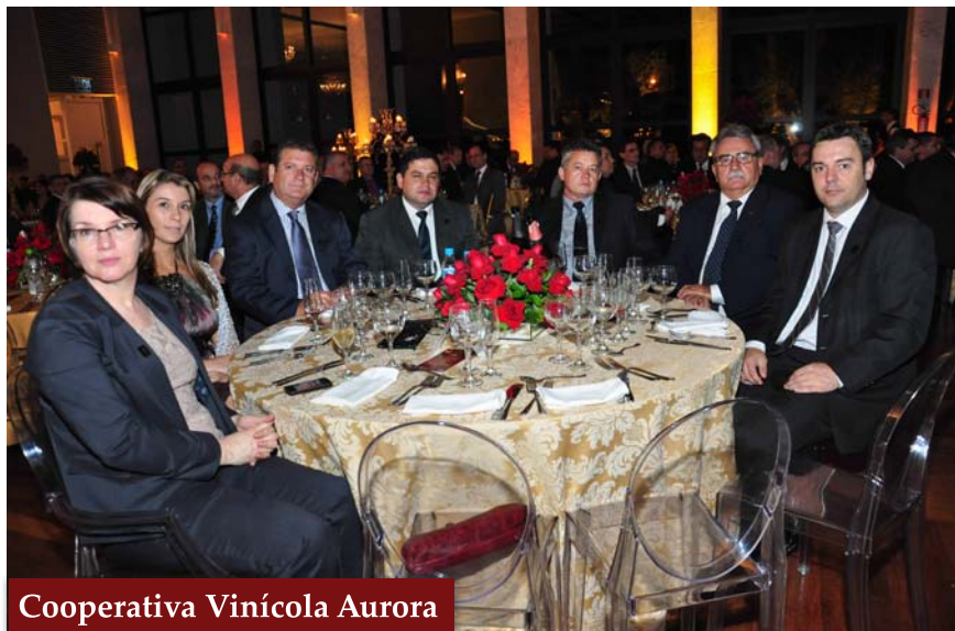
Cooperativa Vinícola Aurora