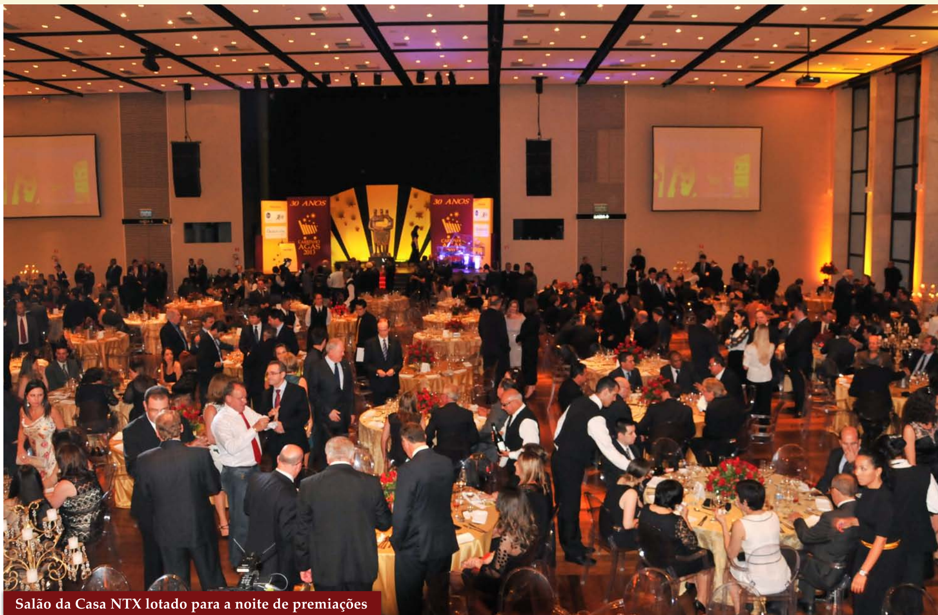
Salão da Casa NTX lotado para a noite de premiações