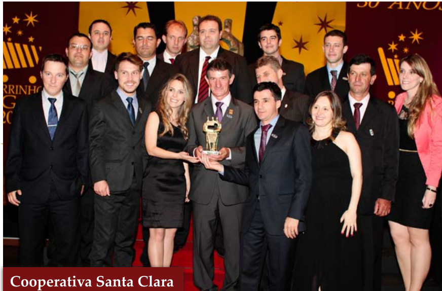
Cooperativa Santa Clara