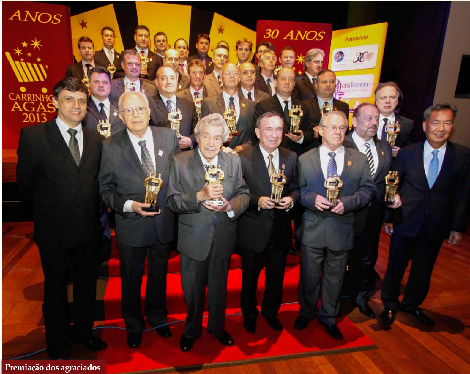
Premiação dos agraciados