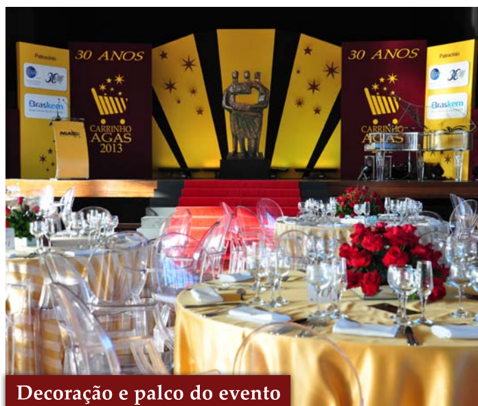
Decoração e palco do evento