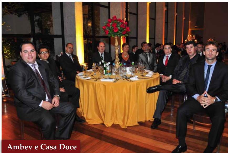
Ambev e Casa Doce