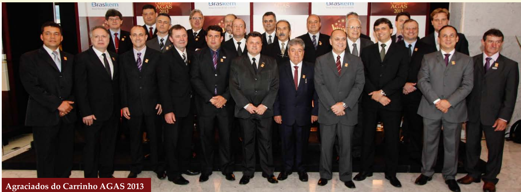
Agraciados do Carrinho AGAS 2013