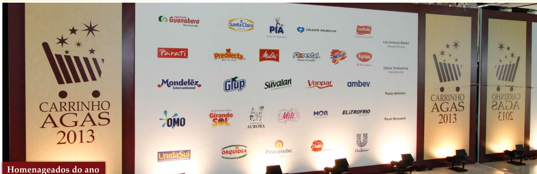
Homenageados do ano