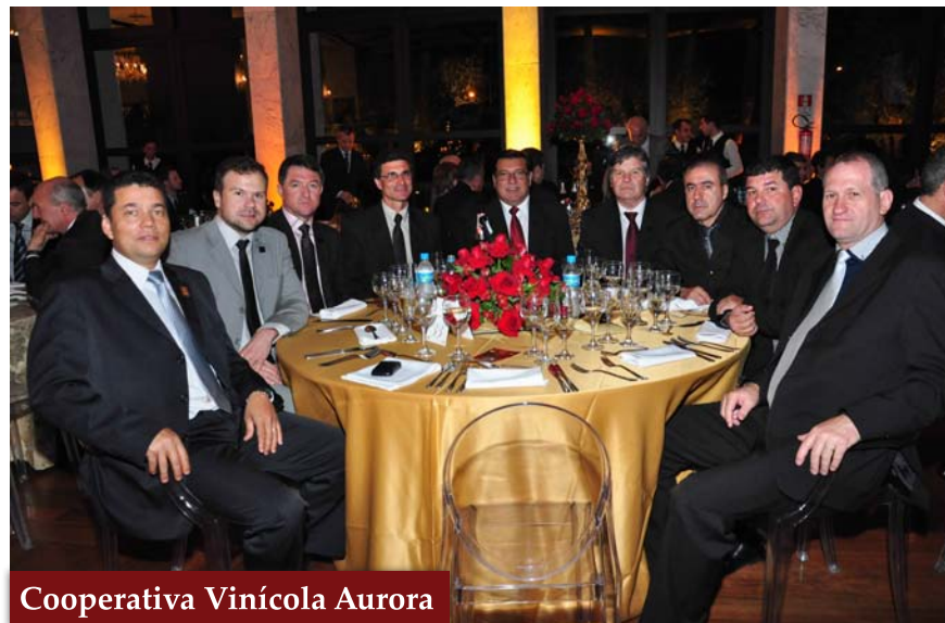
Cooperativa Vinícola Aurora